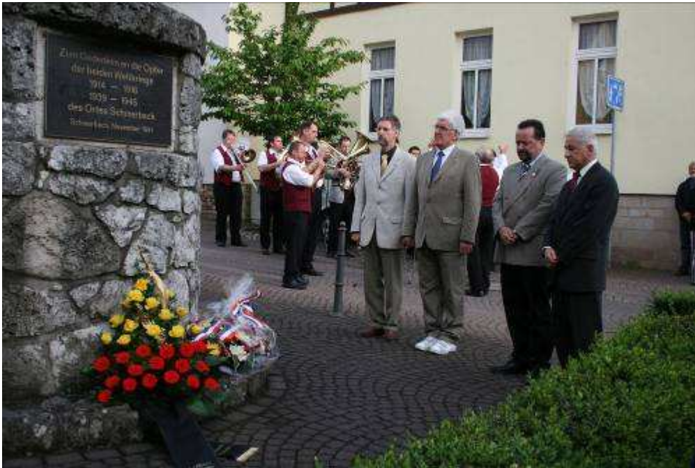
Un grand moment d'émotion : dépôt d'une gerbe au monument aux morts à la mémoire de toutes les victimes des deux guerres.

JUIN 2007 : VISITE D'UNE DELEGATION D'EMSETAL POUR LA FETE DU CANTON