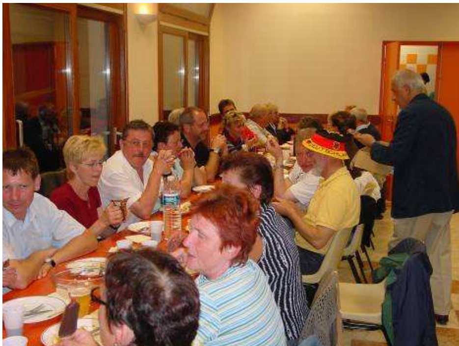
Repas en commun dans la salle des fêtes rénovée d'Hucqueliers.

JUIN 2007 : VISITE D'UNE DELEGATION D'EMSETAL POUR LA FETE DU CANTON